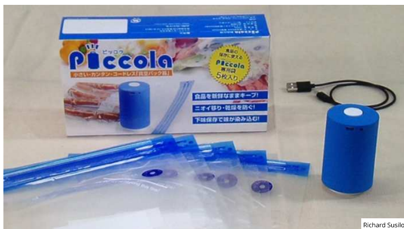
Alat hisap mini Piccola yang baru dari Jepang akan dipasarkan sekitar akhir Januari 2018

Laporan Koresponden Tribunnews.com, Richard Susilo dari Jepang